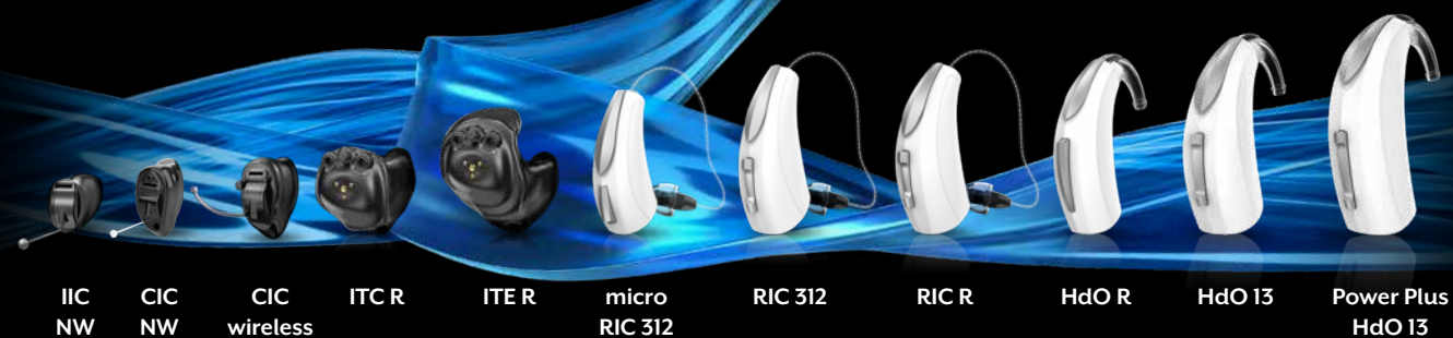
IIC NW CIC NW CIC wireless ITC R ITER micro RIC 312 RIC 312 RIC R HdO R HdO 13 Power Plus HdO 13

Mit Evolv AI erhalten Sie ein vollständiges Portfolio über alle Bauformen, das mit noch besserem Starkey Sound und erweiterter Konnektivität neue Impulse setzt. So haben Ihre Kunden die freie Auswahl an Hörsystemen, die sich jeweils an ihren individuellen Lebensstil anpassen. Wenn es um Innovationen für besseres Hören geht, dürfen Sie die Leichtigkeit des Hörens erwarten.